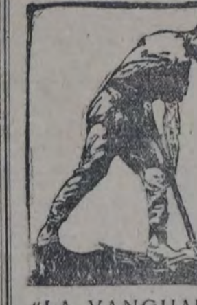
"LA VANGUARDIA" DIARIO DE LA MAÑANA Fundado por JUAN B. JUSTO y otros