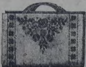
PORTA-LIBROS (25 POR 13 CM. DE TAMAÑO) CON BORDADO AL PUNTO EN CRUZ

El modelo de porta-libros que reproduce nuestro grabado es de tamaño corriente de los libros, y su material consiste en tela "Aida" (4 cuerdas del tejido = 1 cm.) de color arena. Se corta la funda de un trozo de tela en doble altura de la forma de la misma, y luego, para servir de refuerzo a la cubierta del libro se le cose por dentro una tira de tela de 8 cm. de ancho que remata los tres lados. Ambas caras de nuestro práctico modelo están adornadas con un vistoso dibujo, figurando rosas y otras flores, y cuyo tipo de tamaño aumentado, lo encontrarán nuestras lectoras en el grabado que figura al pie de esta nota.