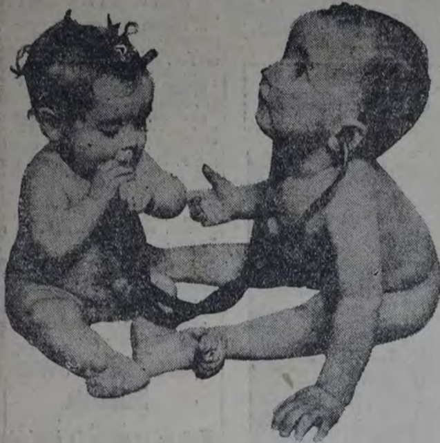
Es realmente conmovedora la curiosidad y la astucia del niño frente a todo lo que para él resulta misterioso. De estos dos niños, el mayor, en actitud de atención ansiosa parece esperar la explicación de algo que lo intriga. El menor acude a un medio de investigación más prosaico y más primitivo.